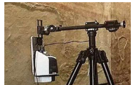
FTIR non a contatto

MADAtec Srl Strumenti Scientifici, Accessori e Assistenza Tecnica