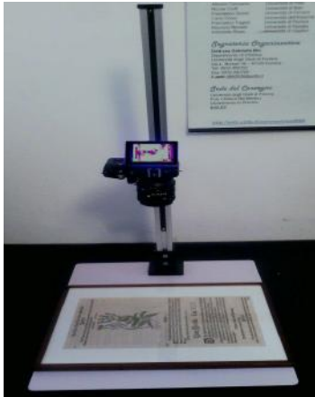
Stand da tavolo

Il sistema Multispettrale Madatec è già stato sperimentato in diverse realtà italiane del Restauro e della Diagnostica dei Beni Culturali, pubbliche e private, con risultati lusinghieri.