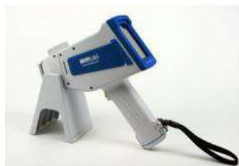
LIBS hand held