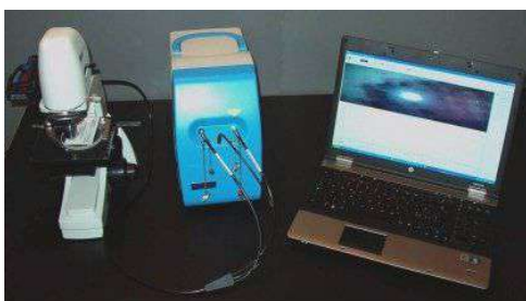
Raman portatile e micro

E dopo la pre-Diagnostica , approfondite con tutta l'altra strumentazione distribuita ed assistita da Madatec srl (alcuni esempi):